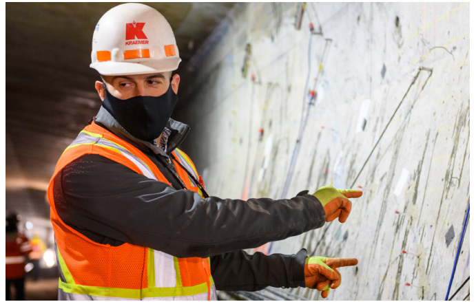
Para saber más sobre cómo responde el puente a diferentes condiciones, las cuadrillas han estado usando un sistema de monitoreo inteligente en una sección del puente con grietas.

La encuesta estará abierta hasta el 18 de enero y está disponible en los siguientes idiomas: inglés, español, somalí, jemer y vietnamita a través de los siguientes enlaces y por debajo: